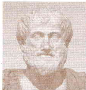
ARISTOTEL a construit ideea de frumos și de teatru în scrierea sa Poetica